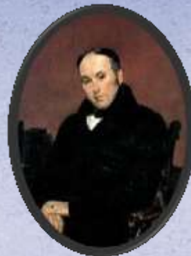
Жуковский, Василий Андреевич (русского язык)