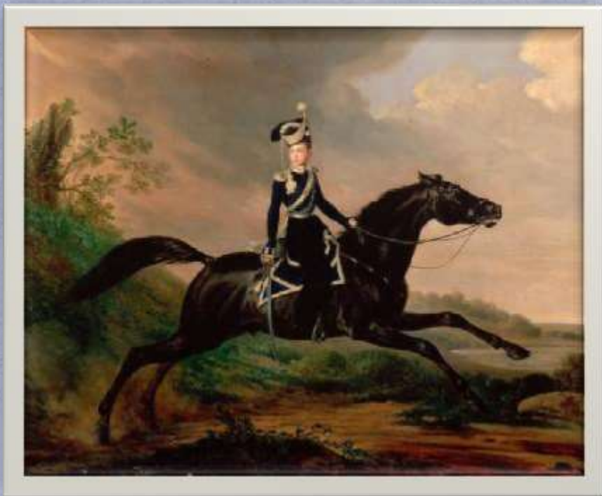
Портрет Александра в юности