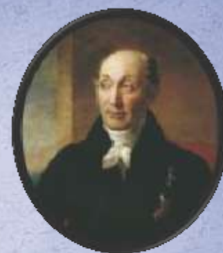
Сперанский, Михаил Михайлович (законодательство)