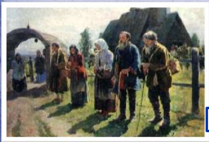
Художник С. А. Виноградова. Нищие

Распалась цепь великая, Распалась и ударила Одним концом – по барину Другим – по мужику?