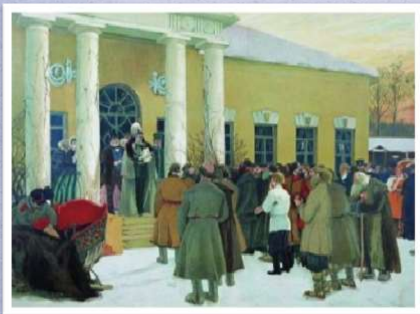
Художник Б.М. Кустодиев. Освобождение крестьян. Чтение манифеста.