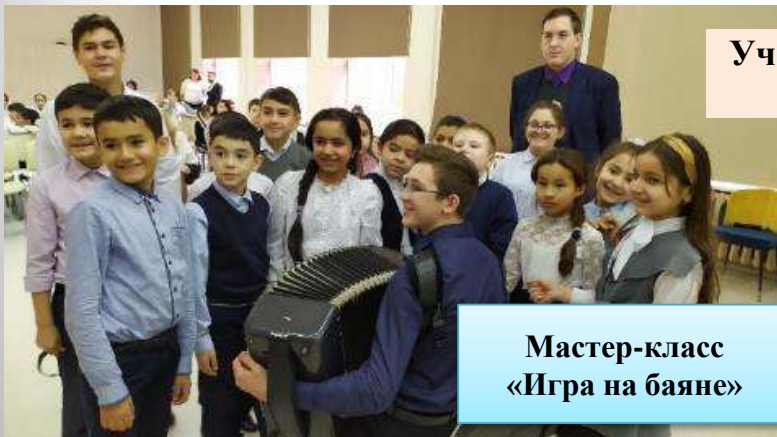
Мастер-класс «Игра на баяне»