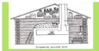
Устройство русской печи