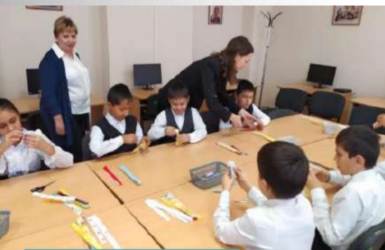
Мастер-класс «Изготовление северной куклы- берегини»