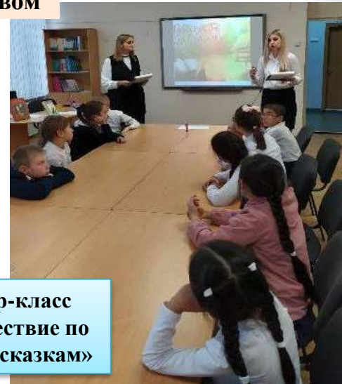
Мастер-класс «Путешествие по русским сказкам»