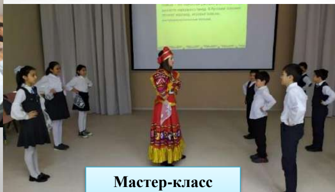
Мастер-класс «Русский народный танец»