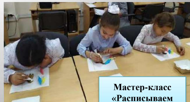
Мастер-класс «Расписываем русский пряник»