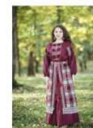
Жетпінский народный костюм